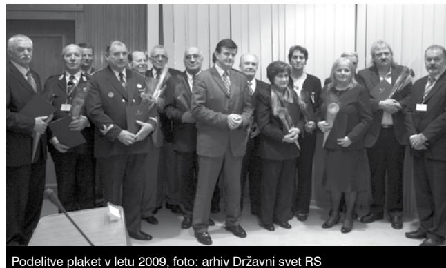
Podelitve plaket v letu 2009

Več informacij in obrazci za posredovanje prijav so objavljeni na spletni strani ZDOS www.zdos.si .