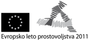
Evropsko leto prostovoljstva 2011

Evropsko leto prostovoljstva 2011: »Bodi prostovoljec, spreminjaj svet«