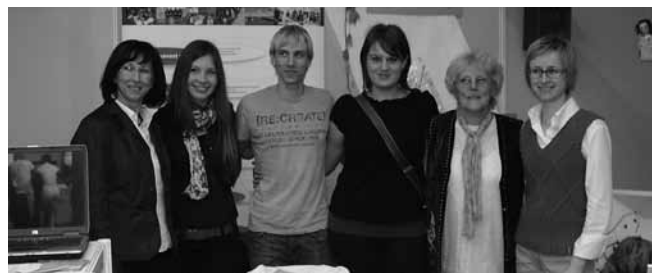
Nagrajenke in nagrajenec nagradnega natečaja iz Gimnazije Ormož - Peka kruha nekoč in danes na ormoškem območju. Izdelek - različne vrste kruha iz krušne peči so razstavili na stojnici ZOTKS in ga ponudili obiskovalcem.